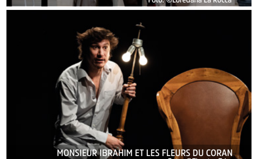
MONSIEUR IBRAHIM ET LES FLEURS DU CORAN