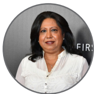
Pramila Patten Représentante Spéciale du Secrétaire Général sur les violences sexuelles dans les zones de conflit