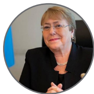
Michelle Bachelet Haut-Commissaire aux droits de l'homme